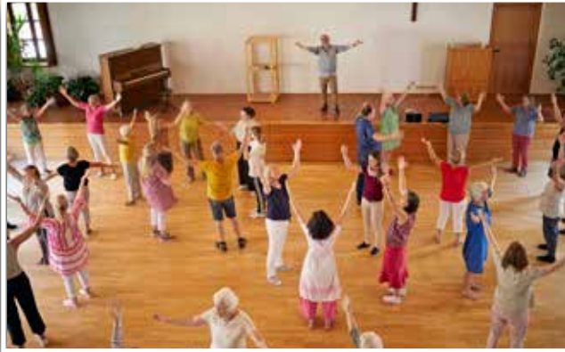
Landeschortag 2023, Workshop