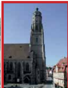
Nördlingen 27. Juni 2020